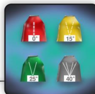
Быстросъемные форсунки с разным углом распыления