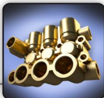
Высокопроизводительная латунная помпа с функцией регуляции давления и керамическим покрытием плунжеров.