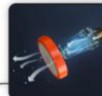
Всасывающий шланг с фильтром