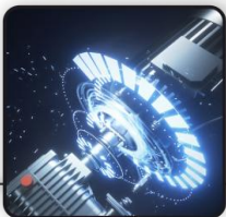
Мощный асинхронный электродвигатель